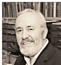
Fotografía tomada de Internet